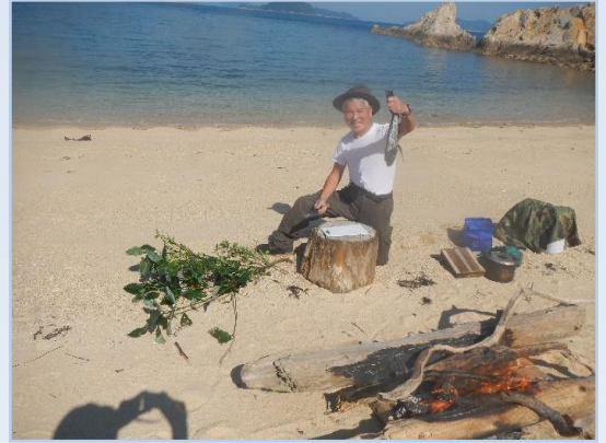
[無人島で釣り三昧！たき火三昧！！]